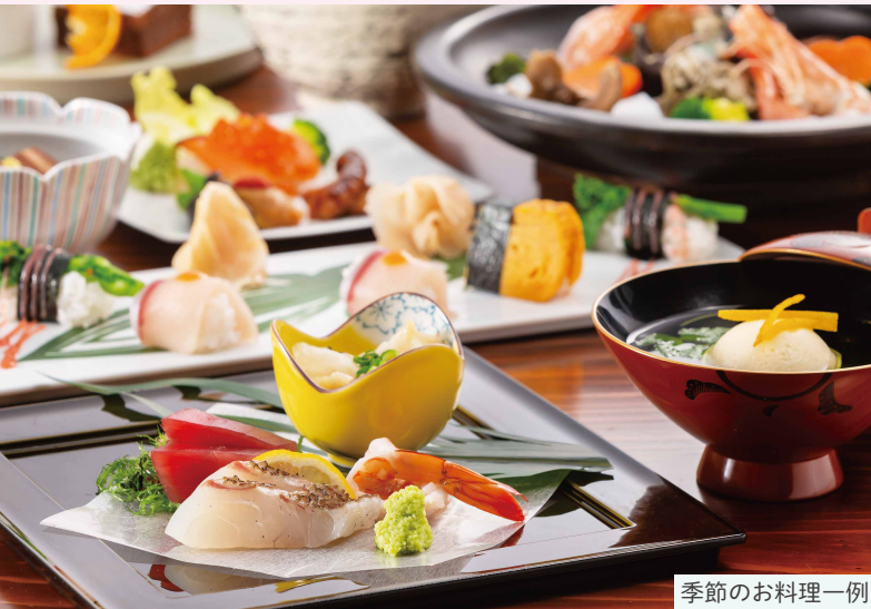
季節のお料理一例