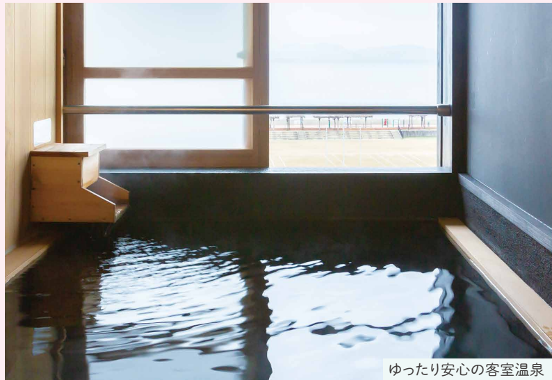
ゆったり安心の客室温泉